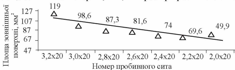
Рис. 1. Площа зовнішньої поверхні зерна тритикале сорту Алкід залежно від його геометричних розмірів

де y — площа зовнішньої поверхні, мм 2 ; x — розмір пробивного сита, мм.