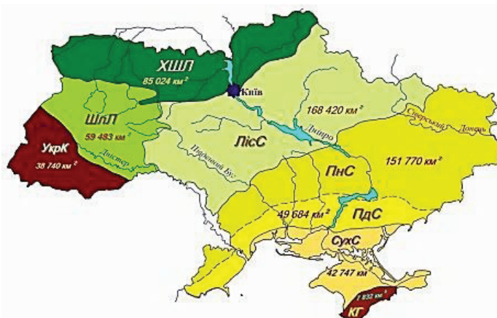
Рис. 2. Площі основних складових частин ландшафтного районування України, визначені з використанням ГІС

Визначалися площі ландшафтних зон і підзон рівнинної частини України, а також гірських країн. Найбільшою є Степова зона (якщо рахувати навіть без сухих степів). Вона охоплює 201 454 км 2 , що становить приблизно 33,3% території України. Загальні результати опрацювань щодо відповідних площ наведені в табл. 1.