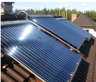
Рис. 1. Зовнішній вигляд змонтованих робочих блоків сонячних батарей

На верхні шари атмосфери Землі постійно поступає 174 РW сонячної радіації (інсоляції). Близько 6 % інсоляції відбивається атмосферою, 16 % поглинається нею. Середні шари атмосфери в залежності від погодних умов (хмари, пил, атмосферні забруднення) віддзеркалюють до 20 % інсоляції та поглинають 3 %. Атмосфера не тільки зменшує кількість сонячної енергії, що досягає поверхні Землі, але і дифузія близько 20 % з того що поступає, та фільтрує частину його спектру. Після проходження атмосфери близько половини інсоляції знаходиться в видимій частині спектру. Друга половина знаходиться переважно в інфрачервоній частині спектру. Тільки незначна частина цієї інсоляції припадає на ультрафіолетове випромінювання. Абсорбція сонячної енергії через атмосферну конвекцію, випаровування і конденсацію водяної пари є рушійною силою кругообігу води та керує вітрами. Сонячне проміння абсорбоване океаном та суходолом підтримує середню температуру на поверхні Землі, що в наш час становить 14 °С.