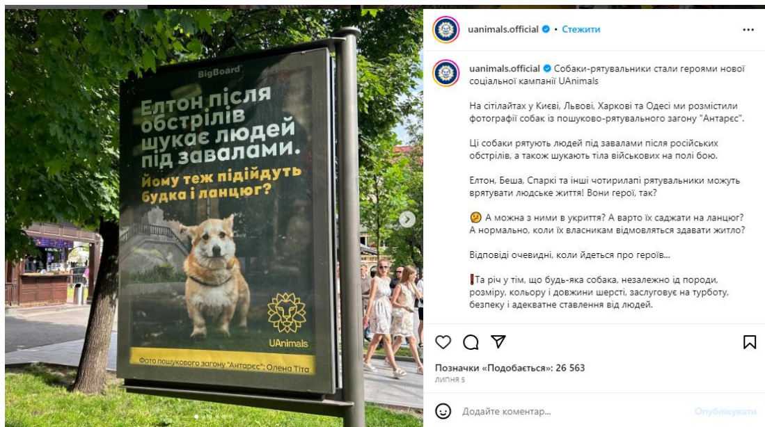
Рис. 5. Публікація у Instagram «UAnimals» та зовнішня реклама вулицями міст України (липень 2023)

Ще один рекламний постер із прив'язкою до актуальних подій поданий на рис. 5.