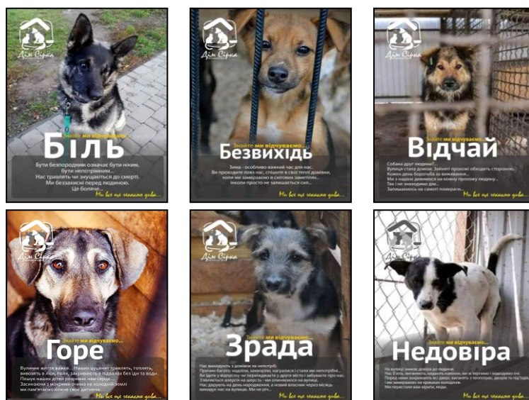
Рис. 1. Соціальна реклама про безпритульних тварин від БО «Дім Сірка»

Соціальна реклама про захист тварин набуває розвитку в Україні, що є позитивним явищем. Проаналізуємо складові впливу у окремих рекламних повідомленнях (рис. 1 – 2).