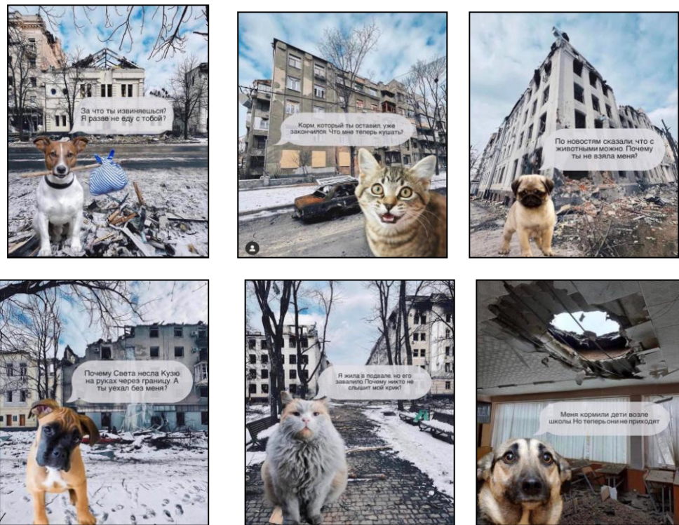
Рис. 3. Публікації у Facebook «Альянсу Захисників Тварин» (березень 2022)