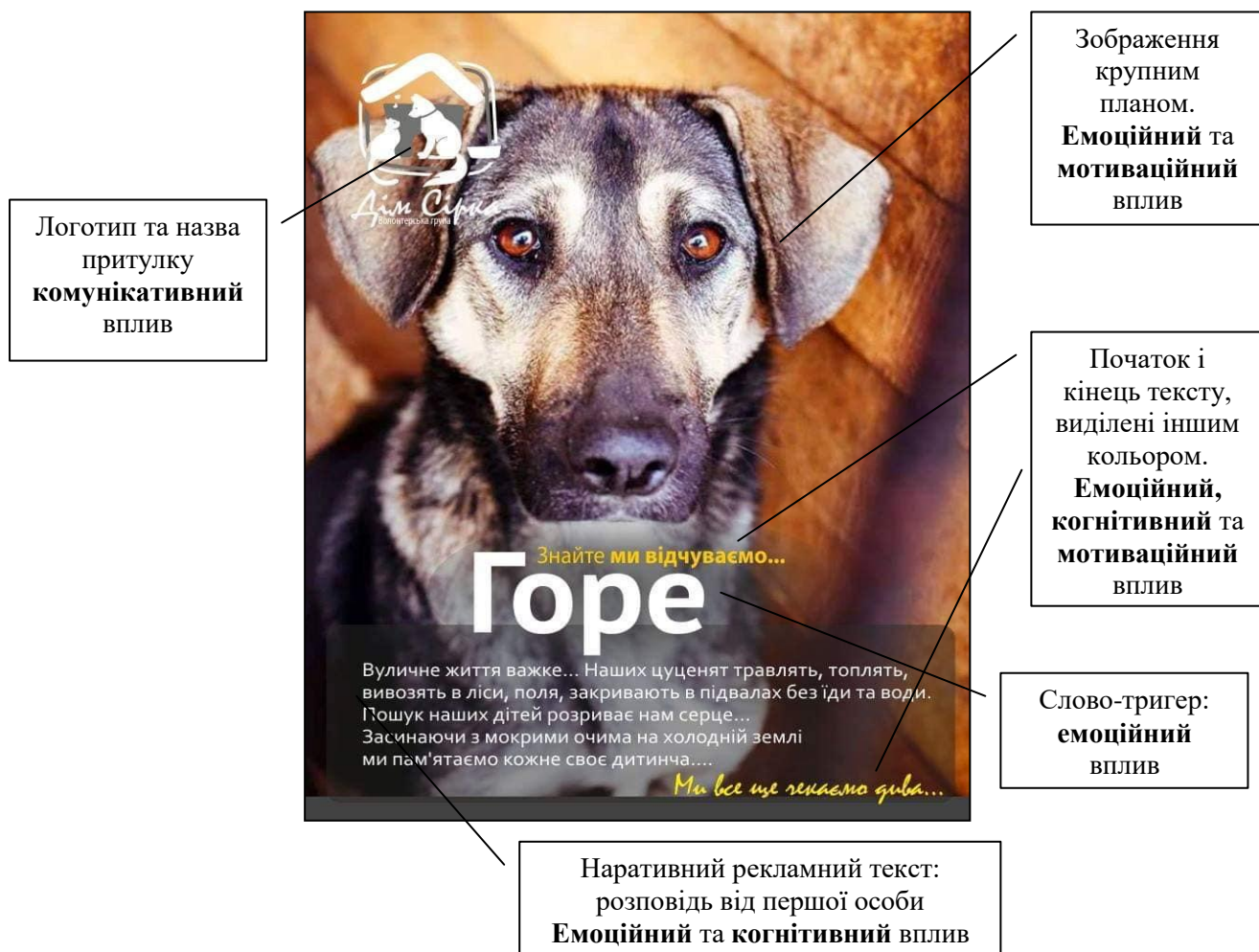
Рис. 2. Компоненти рекламного плакату від БО «Дім Сірка»