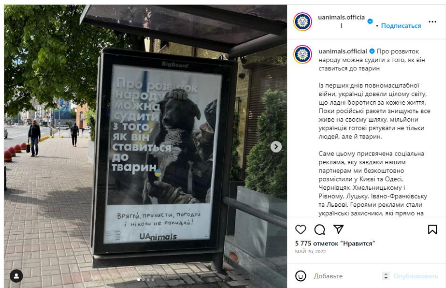
Рис. 4. Публікація у Instagram «UAnimals» та зовнішня реклама вулицями міст України (травень 2022)