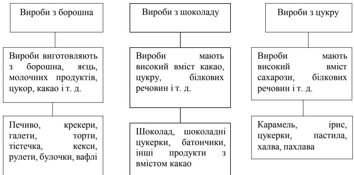
Рис. 2.1 Класифікація кондитерських виробів за категоріями