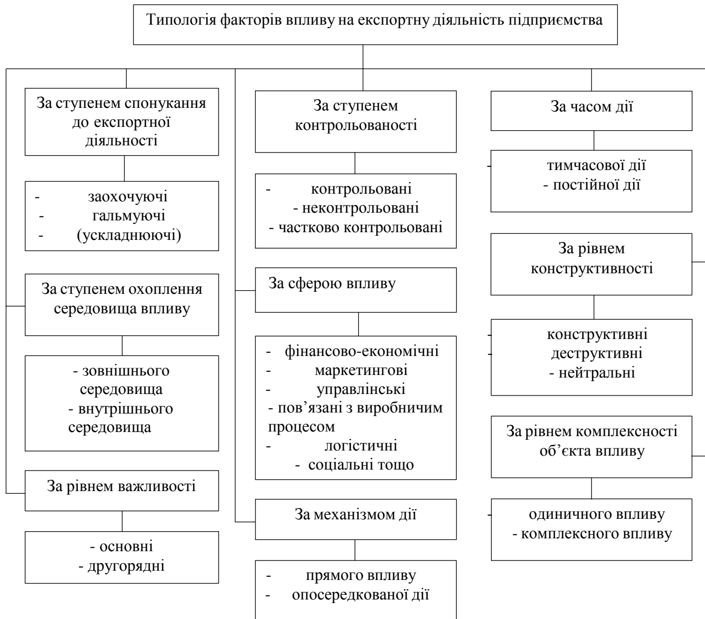
Рис. 1.2 Типологія факторів впливу на експортну діяльність підприємства

2. За ступенем охоплення середовища впливу: фактори зовнішнього середовища та фактори внутрішнього середовища. До факторів зовнішнього середовища зараховують: економічну ситуацію в країнах експортера та контрагентів; політичні обставини; імпортерів – споживачів продукції; постачальників тощо. До факторів внутрішнього середовища відносять: основні цілі та завдання експортної діяльності підприємства; інформаційну базу