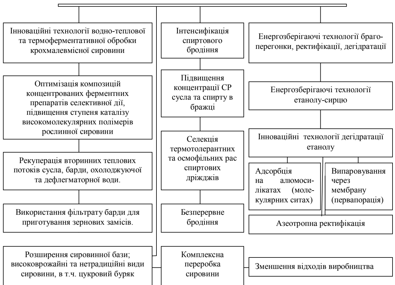
Рис. 1. Технологічні аспекти виробництва паливного етанолу