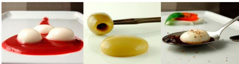
Рисунок 3 – Приклади страв, отриманих методом зворотної сферифікації

У зв'язку з вищенаведеними особливостями зворотна сферифікація може бути застосована для приготування багатьох страв та кулінарних виробів (наприклад, начинки у бісквітах або мусах, а також у молекулярній міксології). З використанням зворотної сферифікації можна отримати такі страви, як: йогуртові сфери, сферичні оливки та сфери з сиру моцарелла (рис. 3).