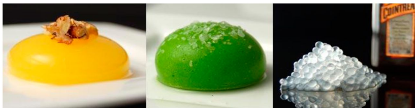
Рисунок 1 – Приклади страв, отриманих методом основної сферифікації

Прикладами страв, отриманих з використанням методу основної сферифікації, є сферичні равіоли з манго і горохові равіоли (рис. 1).