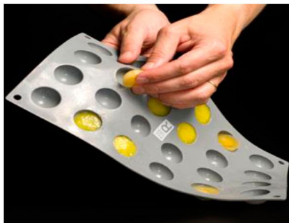
Рисунок 4 – Силіконові напівкулькові форми для заморожування

тільки для харчових інгредієнтів у вигляді розчинів, які замерзають при температурі не вище -18^{\circ}\text{C} і які можна обробляти при низьких температурах без незворотних змін у їхньому фізико-хімічному складі [5; 7].