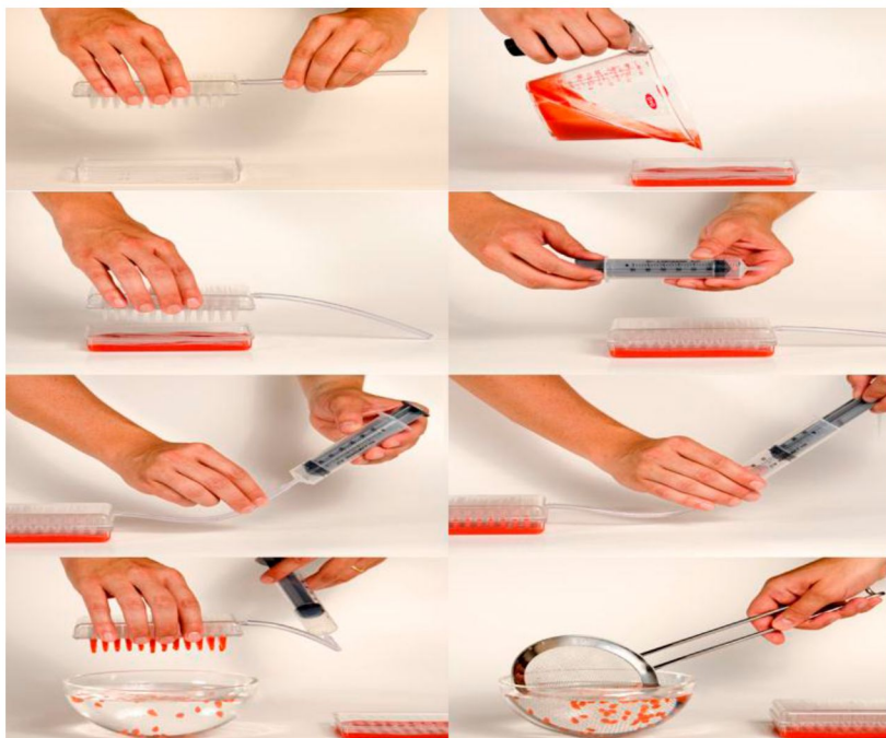
Рисунок 2 – Пристрій для отримання ікри методом основної сферифікації

Суттєва відмінність методу зворотної сферифікації від основної полягає в зануренні рідини з сумішшю глюконату і лактату кальцію у ванну з альгінатом натрію та наступному промиванні у чистій воді. Переваги зворотної сферифікації полягають у завчасному приготуванні сфер та можливості надати сферам додаткового аромату (наприклад, занурення в ароматизовану олію). Процес драглетування відбувається на поверхні сфери, тому альгінат натрію не може проникнути всередину. Напівпрозорий шар гелю утворюється навколо основного інгредієнта. За умови використання зворотної сферифікації смак основного інгредієнта не змінюється, так як глюконат і лактат кальцію не мають вираженого смаку і розчиняються в рідині, не змінюючи її густину. Недоліками зворотної сферифікації вважають те, що сфери мають товсті мембрани (окрім неповторних відчуттів самої страви, відчувається також тверда оболонка навколо сфери). Ванну з альгінатом натрію (0,5%) потрібно витримувати при температурі 4...6° С впродовж 12–24 год, перш ніж використовувати для зворотної сферифікації, щоб видалити бульбашки повітря, створені в процесі розчинення альгінату натрію за допомогою