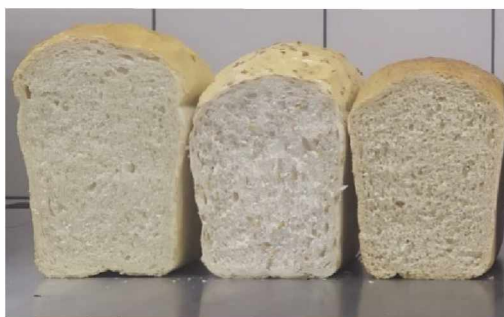
Рис. 1. Фото хліба (зліва направо): контроль; 15% цілого насіння льону; 20% подрібненого насіння льону

Лабораторне випікання булочних виробів з листового дріжджового тіста показало (табл. 2), що зі збільшенням дозування подрібненого насіння льону смакові властивості листових виробів набувають присмаку й запаху льону. Особливо це було відчутно за дозування 20% до маси борошна. Питомий об'єм виробів також зменшувався відповідно до збільшення дозування на 8—29%.