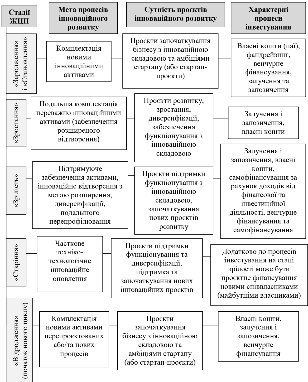
Рис. 3. Процесно-циклічний підхід до формування механізму інвестування інноваційного розвитку підприємства