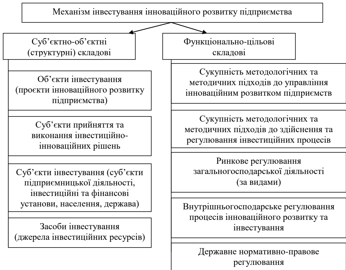
Рис. 2. Статичний (структурний) підхід до формування механізму інвестування інноваційного розвитку підприємства

Статичний підхід відображає структуру механізму, складові якого мають бути задіяні для забезпечення цільового інвестиційного процесу, а також він має містити ті функціонально-цільові елементи, на які спрямований даний інвестиційний процес (рис. 2). Згідно даного підходу до першої структурної групи віднесено суб'єктно-об'єктні складові, а саме: проекти інноваційного розвитку як об'єкти інвестування; суб'єкти розроблення, прийняття та виконання інвестиційно-інноваційних рішень, де першочергово приділяється увага людському кадровому чиннику; суб'єкти інвестування, де йдеться про суб'єкти підприємництва, інвестиційні та фінансові установи, зокрема державні, та населення – це також людський чинник, який часто діє опосередковано, вимагає професійного кадрового