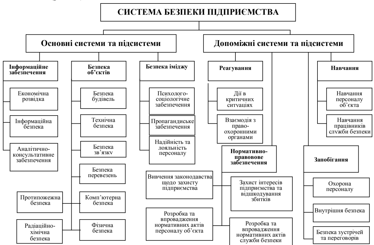
Рис.1. Система економічної безпеки підприємства

Згруповано та доповнено завдання економічної безпеки, що дозволяє комплексно забезпечити досягнення мети створення системи економічної безпеки. На цій основі побудовано систему безпеки підприємства, що відповідає принципам, завданням, основним напрямкам побудови та характеристикам, та враховує інформаційне забезпечення як одну з важливих складових (рис. 1).