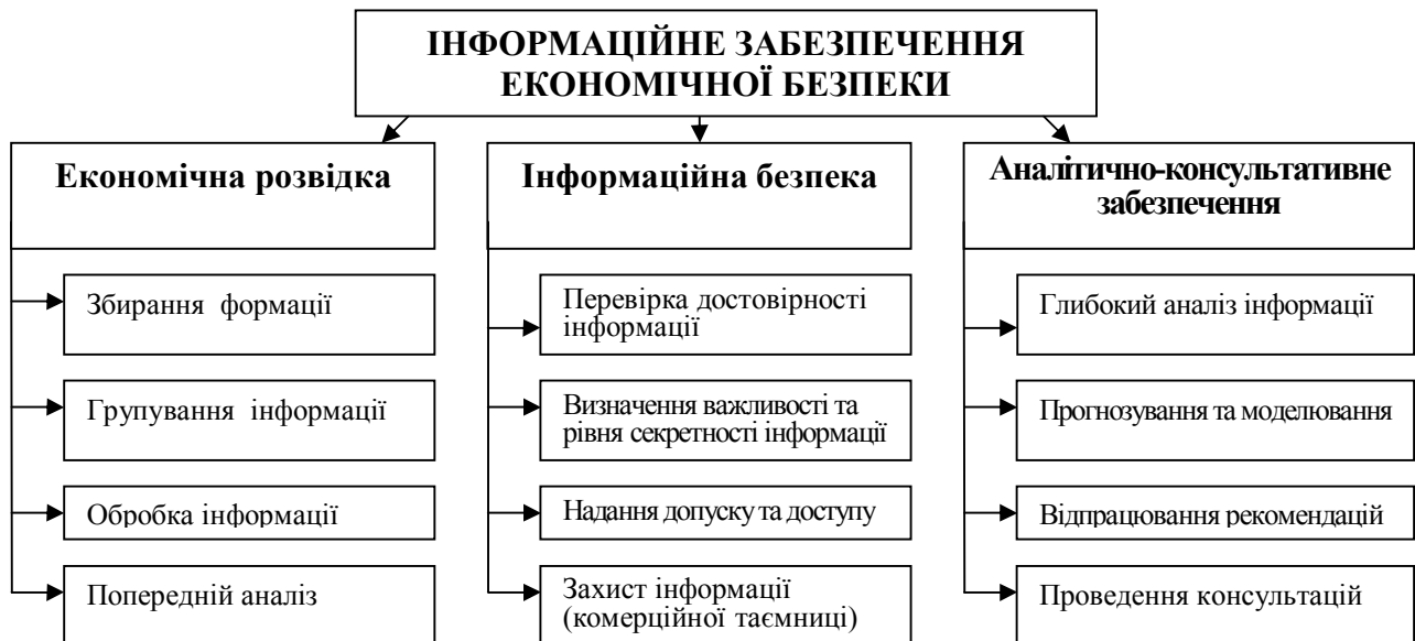
Рис. 2. Завдання системи інформаційного забезпечення економічної безпеки підприємства

Виділено основні завдання інформаційного забезпечення підприємства та на цій основі визначено місце інформаційного забезпечення в системі економічної безпеки підприємства як однієї з основних складових. Для вирішення поставлених перед системою інформаційного забезпечення завдань у її складі виокремлено наступні підсистеми: економічна розвідка, інформаційна безпека та аналітично-консультативне забезпечення, а також складові елементи цих підсистем (рис. 2).