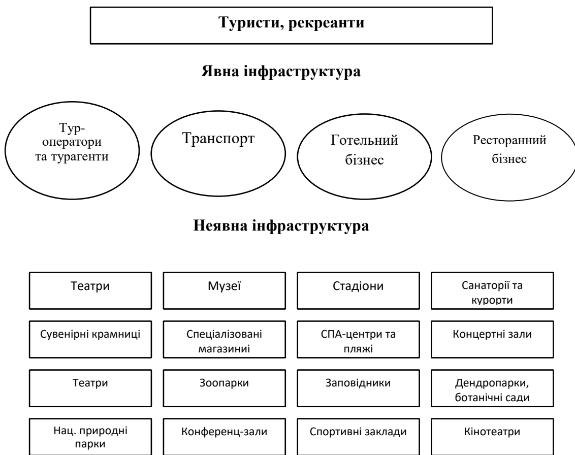
Рис. 1.3. Сегменти інфраструктури рекреаційно-туристичної сфери

Вказані фактори роблять неможливим формування повної та достовірної оцінки стану неявної рекреаційно-туристичної інфраструктури на сучасному етапі. Наявні дані за 2024–2025 роки відображають лише окремі аспекти її функціонування й зазвичай мають фрагментарний характер, що дозволяє окреслити загальні тенденції розвитку та масштаби втрат, але не забезпечує вичерпної статистичної точності. У процесі подальшого аналізу важливо враховувати обмеженість інформаційної бази та необхідність її доповнення після стабілізації ситуації в країні.