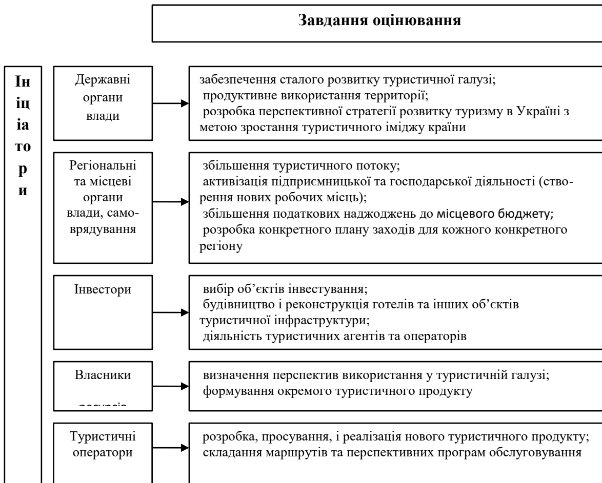
Рис. 1.2. Основні завдання оцінювання туристично-рекреаційного потенціалу

необхідний для огляду туристичних цінностей, адже саме вони визначають потенціал формування різних категорій туристичних маршрутів та екскурсій.