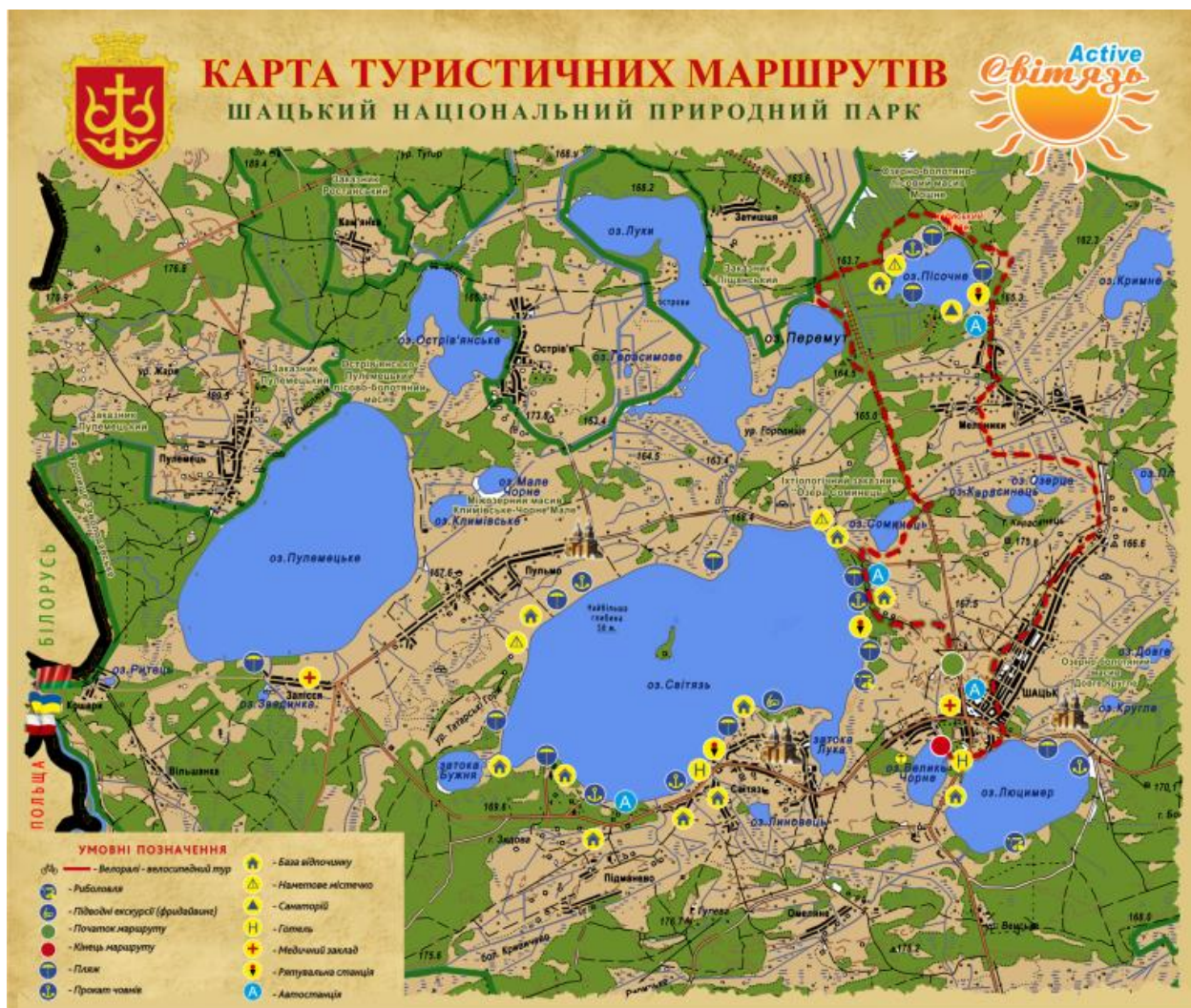
Рис. 3.1. Карта туристичних маршрутів Шацького національного природного парку

Саме ці водойми формують ядро рекреаційної активності в межах парку та користуються стабільним попитом серед відвідувачів у літній період.