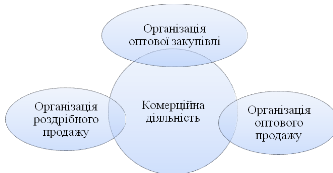
Рис. 1. Складові комерційної діяльності [6, с. 55]

Згідно іншого підходу, запропонованого Криковцевою Н. О., комерційна діяльність розглядається у трьох основних напрямках, кожен з яких включає певний набір послідовних і пов'язаних між собою етапів (складові комерційної діяльності наведені на рис. 1).