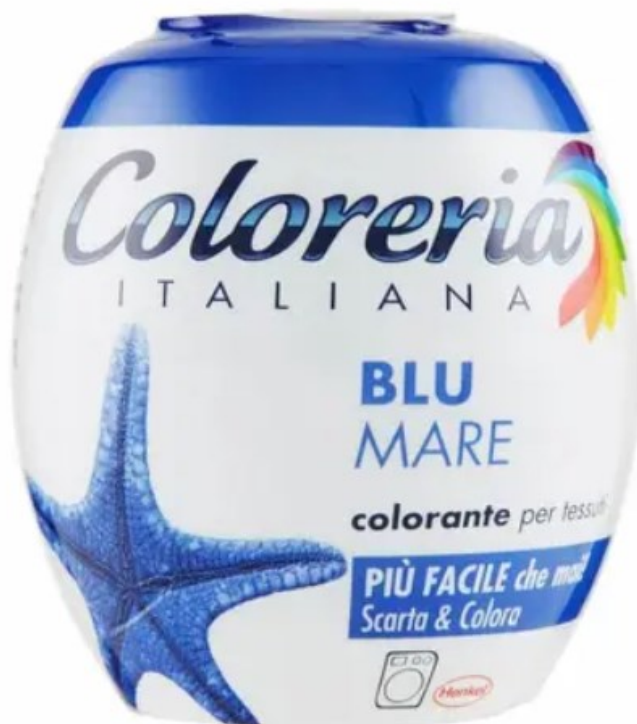
Рис. 7.1. – Приклад пакування пластмасова пляшка

Також пляшки із пластмас після використання потребуватимуть специфічних способів переробки, які як і саме виробництво цих пляшок будуть мати значний вплив на довкілля. Тож такий тип пакування буде недоцільним для даного типу барвника.