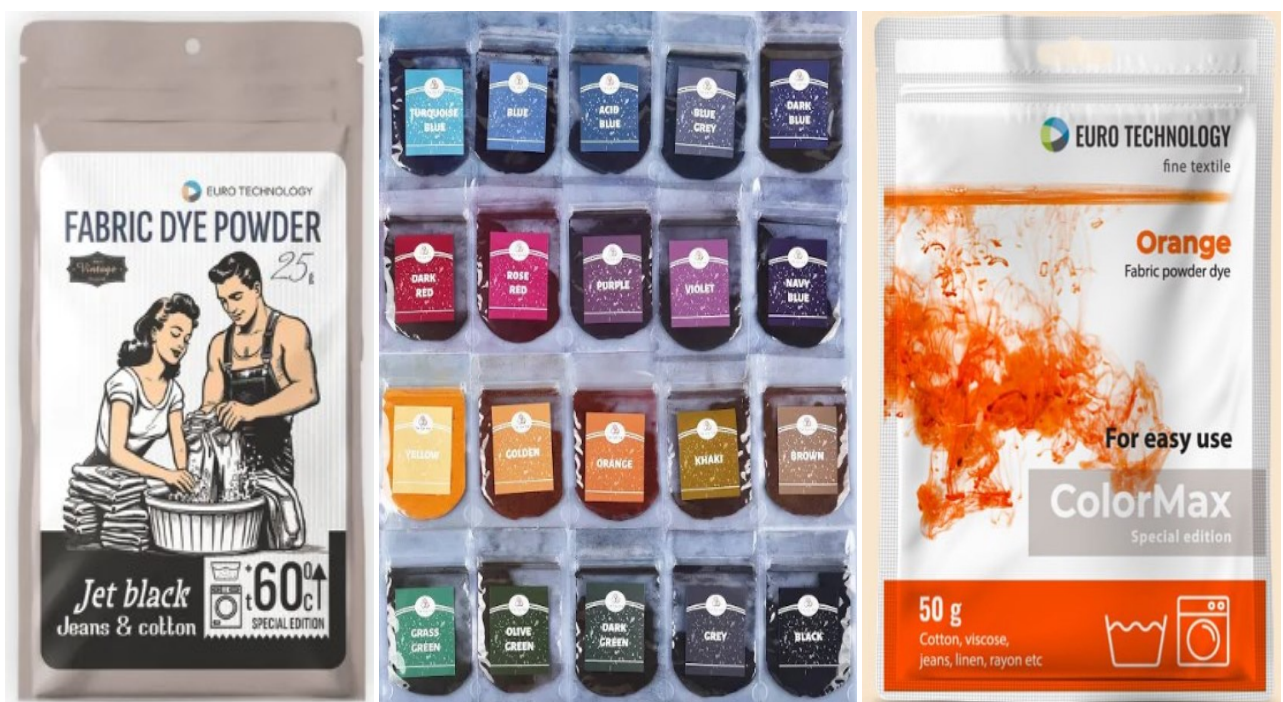
Рис. 7.2. – Приклад пакування поліетиленові пакети та саше

Також пакування такого виду несе екологічну загрозу через тип використовуваного матеріалу.