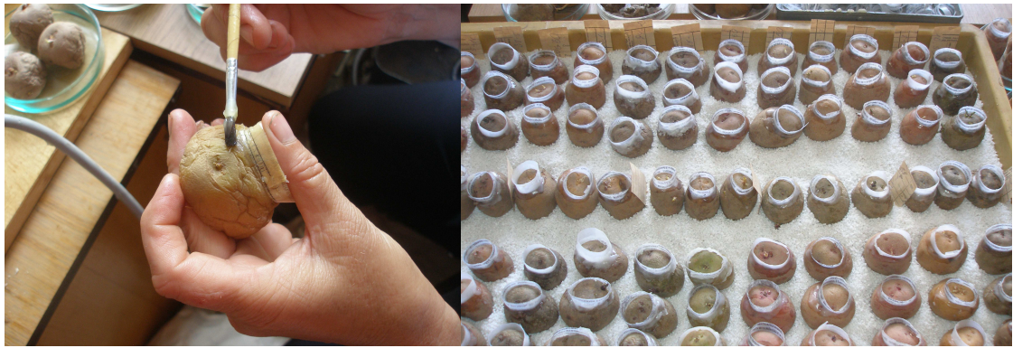
Рис. 2. Зараження зразків картоплі зооспорами зі свіжих ракових наростів