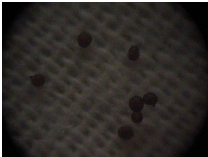
Рис. 6. Цисти золотистої картопляної цистоутворюючої нематоди, виділені на сорті картоплі Поліська рожева

Дослідження проводили на 14 сортах картоплі, отриманих з трьох селекційних та науково-дослідних установ України у с. Поркулина Путильського району Чернівецької області на природному інфекційному фоні з низьким навантаженням ґрунту глободерою (2-3 цисти/100см 3 ґрунту, рис.6). У с. Майдан Міжгірського району Закарпатської області вивчали зразки на природному фоні з навантаженням на ґрунт (13-20 цист/100см 3 ґрунту).