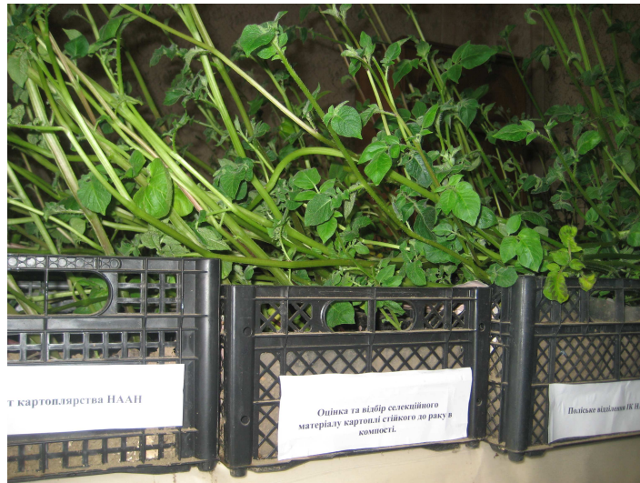
Рис.1. Культивування заражених зразків картоплі зимовими зооспорами (у компості)