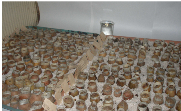
Рис. 3. Інкубація збудника після зараження зразків картоплі літніми зооспорами зі свіжих ракових наростів у клімокамері