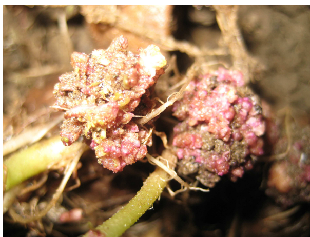
Рис.4. Сорт картоплі Поліська рожева, уражений звичайним патотипом збудника хвороби (у компості)