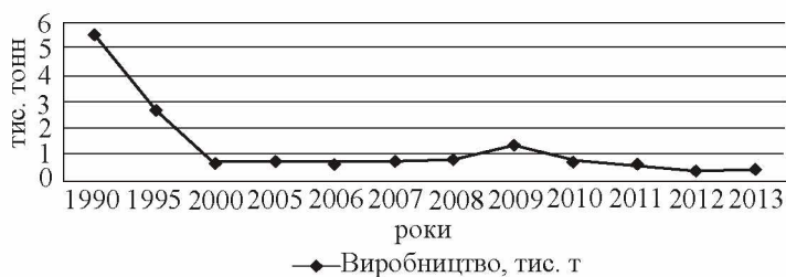
Рис. 1. Виробництво хмелю протягом 1990—2013 років

У 1990 р. в Україні загальна площа насаджень хмелю становила понад 7500 га, а валовий збір — 5555 тонн (рис. 1, 2).