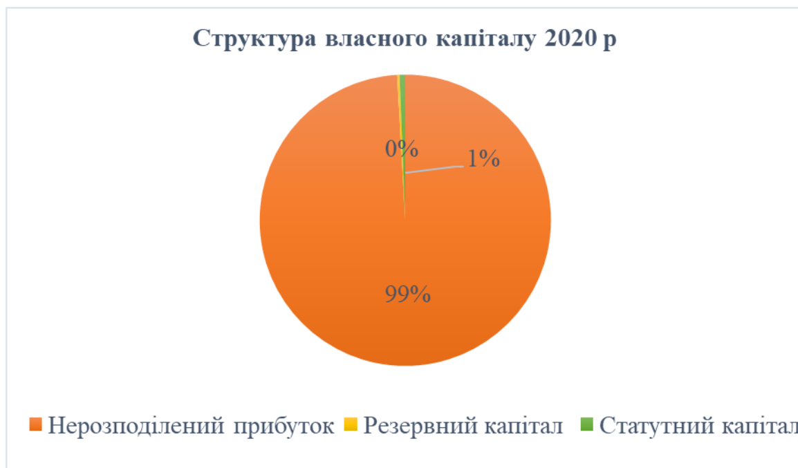
Рис. 2.2. Структура власного капіталу ТДВ «Яготинський маслозавод»

Наочно структуру капіталу ТДВ «Яготинський маслозавод» за 2020 рік можна розглянути на рис. 2.2.