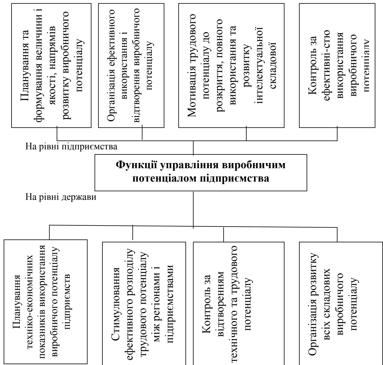
Рис. 2. Функції управління виробничим потенціалом

Аналіз законодавства України засвідчить, що на макрорівні функції управління виробничим потенціалом здійснюють законодавчі та виконавчі органи державної влади, які полягають в: плануванні і формуванні розміру і якості трудового потенціалу – високорозвійеної інтелектуальної, здорової психофізіологічної та активної особистісної складових трудового потенціалу; розробкою амортизаційної політики, спрямованої на відтворення основних засобів, стимулюванні ефективного розподілу трудового потенціалу між підприємствами шляхом розвитку співробітництва між закладами освіти і науки та підприємствами, підприємствами та Державною службою зайнятості для більш ефективного розподілу трудового потенціалу між територіальними одиницями і підприємствами різних галузей; проведенні контролю за відтворенням трудового потенціалу шляхом аудиту