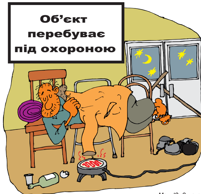
Мал. Ю. Судака

Нещасний випадок визнано таким, що пов'язаний з виробництвом.