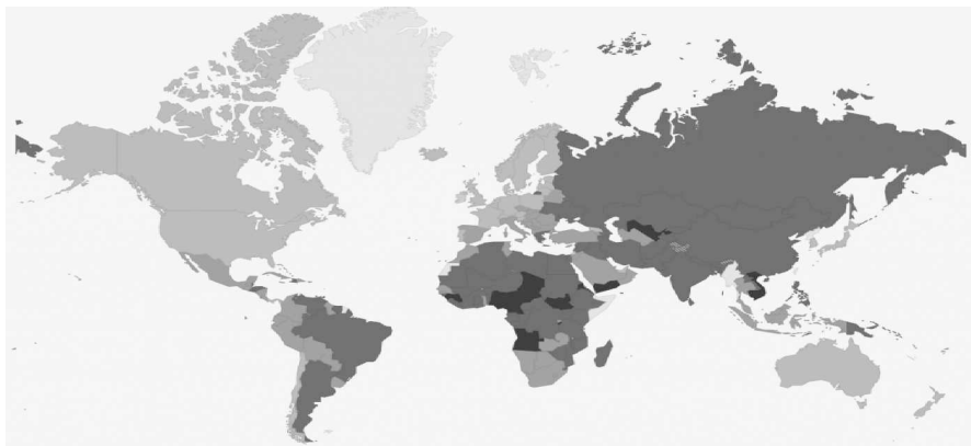
Рис. 2. Географічна структура корупційних ризиків у світі [3]

Не менш цікавим та інформативним є Індекс корупційних ризиків, опублікований TRACE [3]. Дослідженням Індeksu корупційних ризиків було охоплено 197 країн світу. За результатами 2014 р. країни розподілилися за 5 групами: від 0 до 20 — дуже слабкий, від 20 до 40 — слабкий, від 40 до 60 — помірний, від 60 до 80 — сильний, понад 80 — дуже сильний ризик. На рис. 2 більш насичений колір свідчить про більш високий рівень корупційних ризиків.