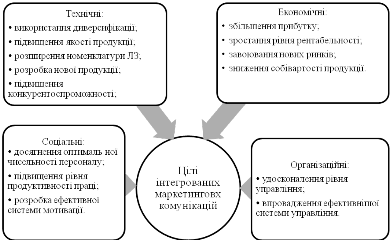
Рис. 2 Цілі ЗАТ «Ліктрави»

Оптимальний комплекс інтегрованих маркетингових комунікацій має бути спрямованим на досягнення сформульованих підприємством цілей (рис. 2).