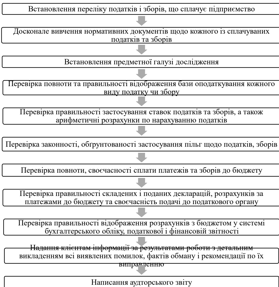
Рис.3.1. Схема послідовності проведення аудиту розрахунків з бюджетом по податкам і зборам

Схема послідовності проведення аудиту розрахунків з бюджетом наведено на наступному рисунку 3.1.