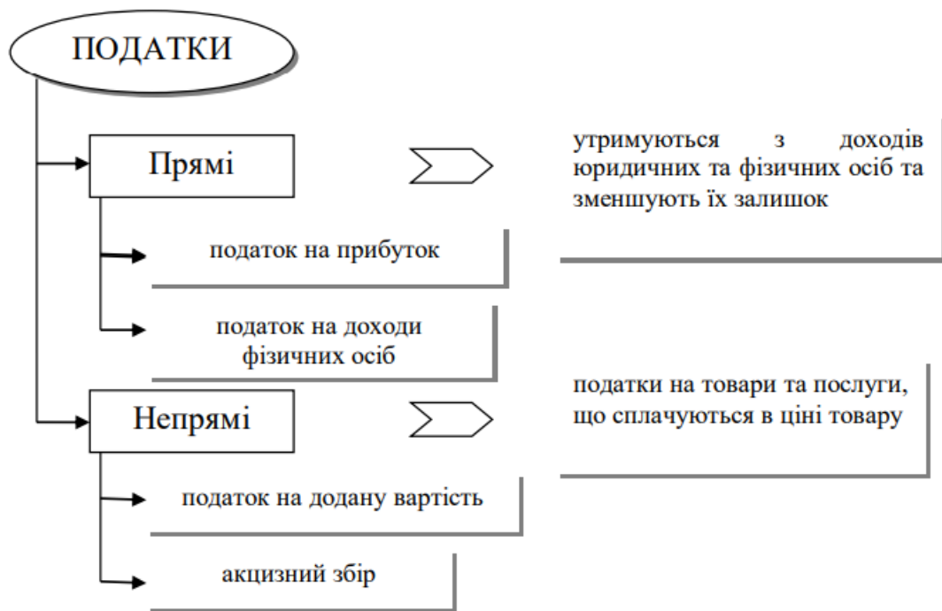
Рис. 1.1. Основі види податків

На нашу думку, особливості ведення податкового обліку на підприємстві необхідно розкрити в окремому розділі наказу про облікову політику. Відсутність оновлених інструкцій з облікової політики загалом, і частини бюджетного розрахунку зокрема, є недоліком корпоративних бухгалтерських організацій. Тому що надання своєчасної, достовірної, повної та об'єктивної інформації відповідно до чітко встановленої облікової політики допоможе уникнути помилок у розрахунках по нарахуванню і утриманню податків, а також відшкодувати витрати на штрафи та інші форми фінансових санкцій. Таким чином, у наказах щодо корпоративної облікової політики необхідно розкривати наступні методи та процедури, щоб отримати своєчасну, ефективну, достовірну та об'єктивну інформацію про: