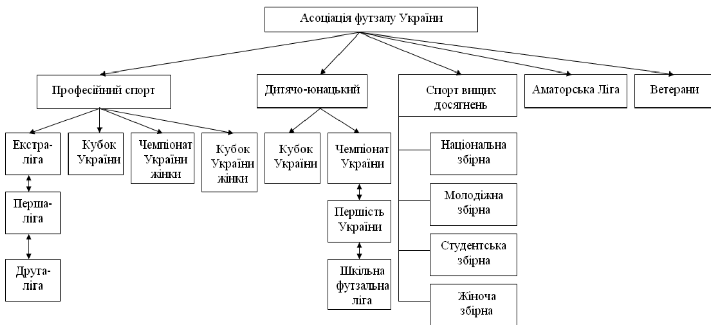
Рис. 2. Система змагань з футболу, що проводяться під егідою АФУ

Важливим моментом в розвитку виду спорту є система змагань. Асоціація футболу України проводить змагання з усіх основних напрямків розвитку спорт: професійного – чемпіонат, першість, Кубок України та Суперкубок України серед команд професійних клубів; чемпіонат, першість і Кубок України серед жіночих команд; спорту вищих досягнень – збірні команди України (Національна, молодіжна, студентська, жіноча) дотримуючись міжнародного календаря матчів, складеного ФІФА/УЄФА; та масового спорту – чемпіонат та Кубок України серед аматорських команд; чемпіонати та першості серед аматорів фізкультурно-спортивних товариств та відомств; чемпіонат і першість України серед дитячо-юнацьких команд у різних вікових категоріях; чемпіонат та Кубок України серед студентських команд (рис.2).