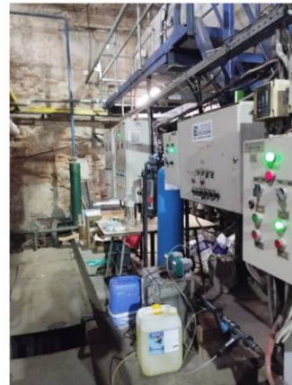
Рис. 1. Схема установки: 1 — станція дозування гіпохлориту натрію; 2 — дисковий фільтр 130 мкм; 3 — станція дозування коагулянту; 4 — мультимедійний фільтр, завантажений 3-ма фракціями АФМ

Принцип роботи установки для попереднього очищення природної води з поверхневих джерел полягає в тому, що вода з поверхневого джерела подається насосом безпосередньо на експериментальну установку, де у трубопроводі додається гіпохлорит натрію за допомогою автоматичної станції дозування (1). Обробка води