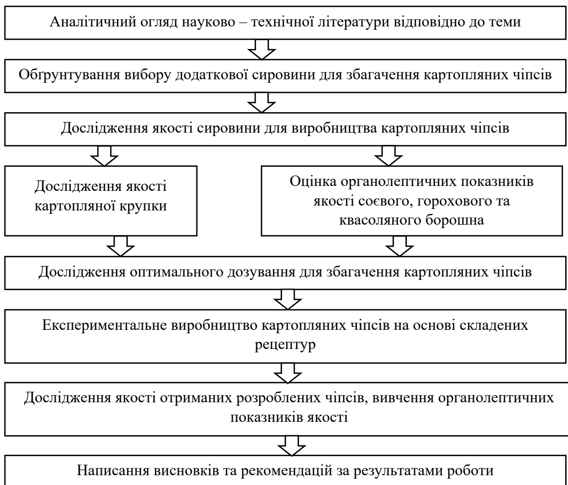
Рис.1.1. Блок-схема досліджень щодо удосконалення технології виробництва картопляних чіпсів

Експериментальну частину виконували в домашніх умовах та в лабораторії кафедри технології хлібопекарських і кондитерських виробів.