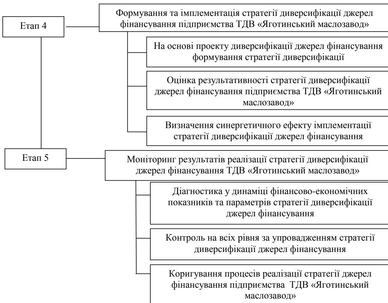
Рис. 3.1 Послідовність здійснення диверсифікації джерел фінансування підприємства ТДВ «Яготинський маслозавод»*