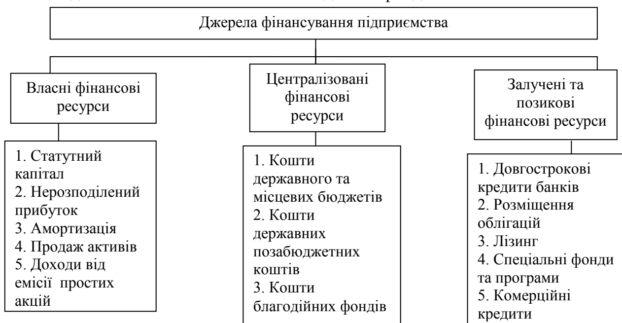
Рис. 1.1 Джерела фінансування підприємства [43, с. 87]

Формування джерел фінансування на думку Самойлової Т.А. відбувається за рахунок трьох джерел, які наведені у рис.1.1. Основна відмінність від підходів Козачка І.А. та Брунько П.В. це запровадження нової форми джерела фінансування підприємства, як централізовані фінансові ресурси. Тобто залучення коштів державного та місцевих бюджетів, державних позабюджетних коштів та коштів благодійних фондів.