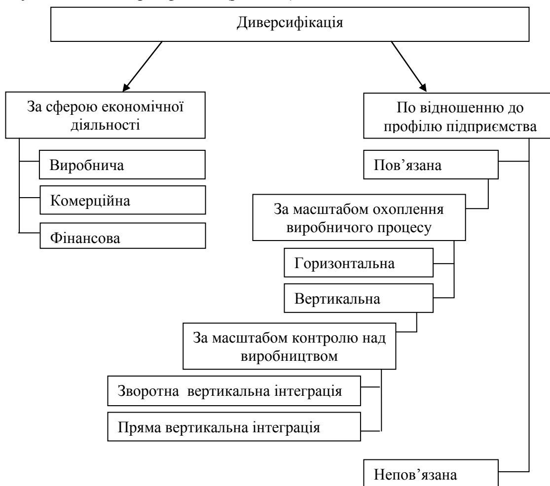
Рис.1.2 Види диверсифікації підприємства [23, с.25]