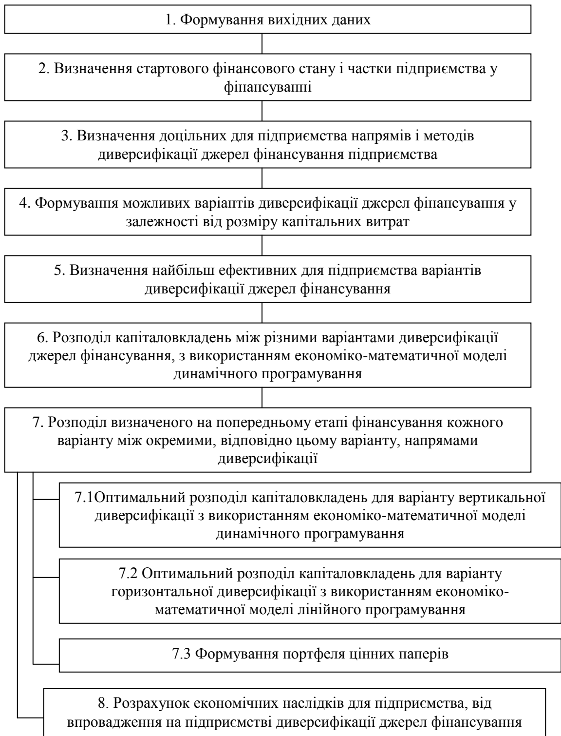
Рис.1.3 Етапи вибору ефективних варіантів диверсифікації джерел фінансування*