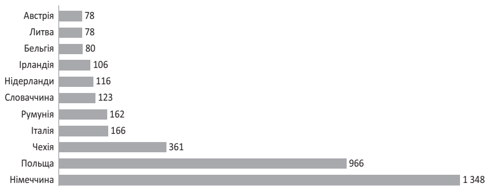
Рис. 1. Чисельність осіб, які отримали тимчасовий захист в європейських країнах, станом на 30 червня 2024 р., тис. осіб

Біженці, що прибули до європейських країн, швидко отримали необхідний захист і безпеку. Спочатку лєвова частка біженців орієнтувалися на короткочасне перебування в приймаючій країні, сподіваючись на швидке закінчення війни. Але через тривалі бойові дії багато з них почали по-іншому сприймати своє перебування в приймаючій країні, вдаючись до пошуку джерел додаткового доходу та економічної активності. Як результат, що підтверджується даними державних архівів і академічних досліджень, ступінь залучен-