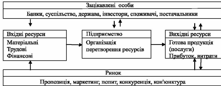
Рис. 3. Елементи процесу формування економічної стійкості підприємства

Процес управління економічною стійкістю полягає в забезпеченні ефективного перетворення ресурсів підприємства у готову продукцію. Система забезпечення такого перетворення включає організацію технологічної, технічної, кадрової, фінансової складових. Виходячи з такого визначення, процес управління економічною стійкістю можна представити у вигляді логічної послідовності блоків, як представлено на (рис 3).