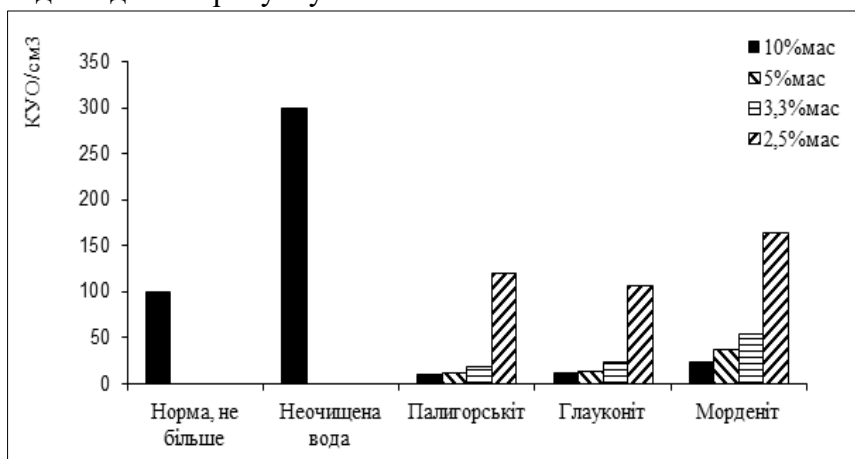
Рис. 1. Вміст бактерій в 1 см 3 води, очищеної палигорськітом, глауконітом, морденітом (КУО/см 3 )

Результати та їх обговорення. Отримані результати мікробіологічних досліджень води подані на рисунку 1.