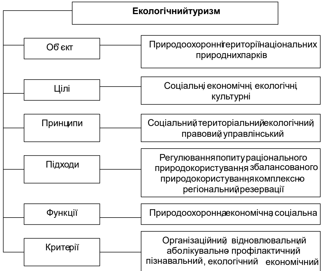
Рис. 1.1. Складники визначення сутності екологічного туризму

якості життя. У зв'язку з цим у багатьох європейських державах утвердилося поняття «права на туризм», що знайшло офіційне закріплення в Глобальному етичному кодексі туризму, схваленому Генеральною асамблеєю Всесвітньої туристичної організації у 1999 році в Чилі.