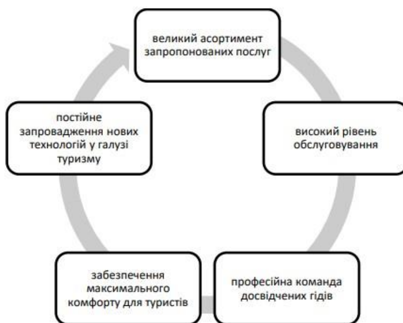
Рис. 2.1. Основні переваги туроператора Join UP!

Join UP! обґрунтовано можна віднести до провідних компаній туристичної індустрії України. Оператор об'єднує розгалужену мережу, яка включає 19 власних агентств, понад 7 300 партнерських офісів і 121 франчайзингову структуру, розміщену в усіх великих містах країни, а також за її межами - зокрема в Молдові та Казахстані. До найбільш затребуваних туристичних напрямів, з якими працює компанія, належать Чорногорія, Єгипет, Туреччина та Об'єднані Арабські Емірати. Важливою конкурентною перевагою туроператора є наявність понад 20 власних чартерних програм, що реалізуються за участю дочірньої авіакомпанії SkyUp Airlines.