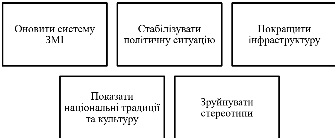
Рис. 3.2. Першочергові завдання для покращення іміджу України

зміними думку світової спільноти на питаннях, що були наведені в (рис. 3.2.)