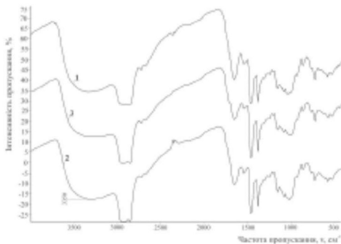
Рис. 3. ІЧ-спектри пропускання 1 – наповнювач «Прозер пшеничний»; 2 – водно-рослинна суміш «вода – наповнювач «Прозер пшеничний»; 3 – рослинно-сироваткова суміш «сироватка молочна – наповнювач «Прозер пшеничний».