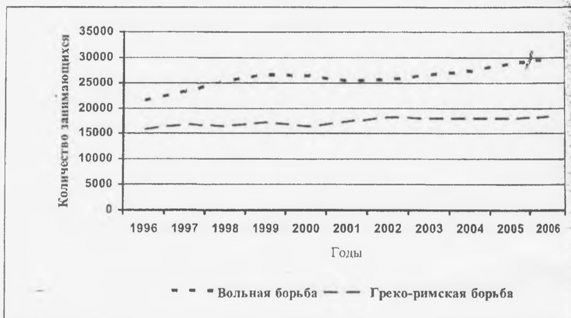
Рис. 2. Количество занимающихся в ДЮСШ вольной и греко-римской борьбой в Украине

На сегодняшний день подготовку в ДЮСШ осуществляют более 1687 штатных тренеров, однако только 23% имеют высшую и первую квалификационную категорию [3].