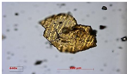
Рис. 1. Мікроструктура частинки насіння льону олійного

Результати дослідження. Вивчення структурних властивостей отриманих частинок з насіння льону олійного (рис. 1) показало, що вони за своєю мікроструктурою вони відповідають мікроструктурі зернової сировини. Мікрофотографії, наведені на рис. 2, свідчать про те що частинки насіння льону, отримані в процесі подрібнення, мають об'ємну структуру, багатогранну форму і майже однакові габаритні розміри, що не перевищують 100 мкм.