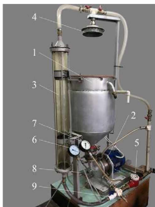
Рис. 1. Аераційно-окиснювальна установка роторного типу (АОРТ):