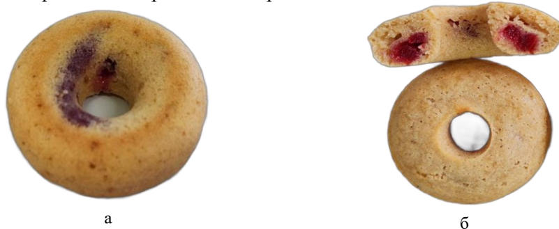
Рис. 2. Видгляд donatів з начинкою при відпрацюванні режимів їх формування

більш доречним з точки зору інтенсифікації процесу виробництва та зниження ресурсозатратності запропонованої технології і узгоджується з принципами сталого розвитку та принципами органічного виробництва.