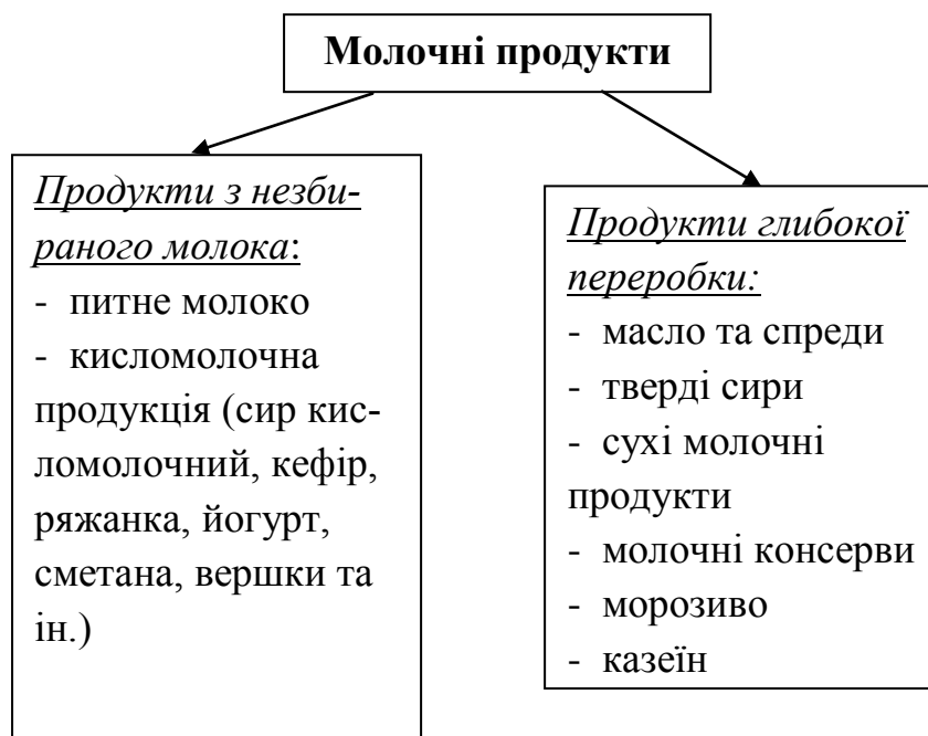
Рис. 3 Основні види молочних продуктів 1

Основні напрямки виробництва молочних продуктів в Україні за якими проводяться статистичні дослідження представлено на рис. 3.