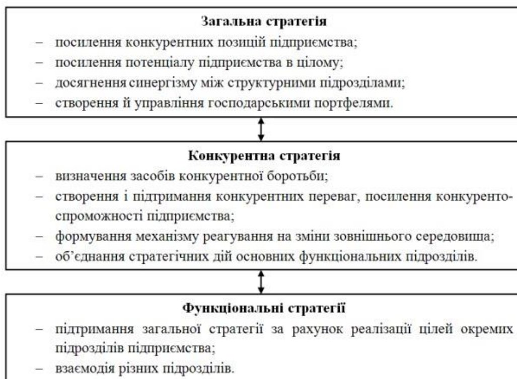
Рис. 3.2 Система стратегій підприємства

системи стратегічного управління, то виникає необхідність в ознайомленні з основними стратегіями підприємства. Система стратегій представлена на рис. 3.2.