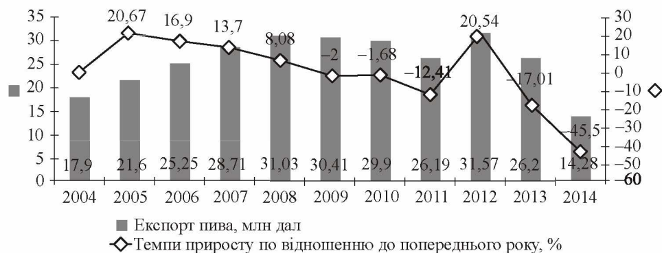
Рис. 2. Динаміка експорту пива з України у 2004—2014 рр.

Експорт пива у натуральних одиницях виміру протягом 2004—2008 рр. мав тенденцію до зростання (рис. 2) завдяки інтенсивному розвитку трьох потужних пивних корпорацій. Експорт українського пива здійснюється в 42 країни світу. За підсумками 2009—2011 рр. поставки пива з України знижувалися. Це відбулося через різке скорочення експорту до Росії та Білорусі в результаті прийняття ними протекціоністських законів.