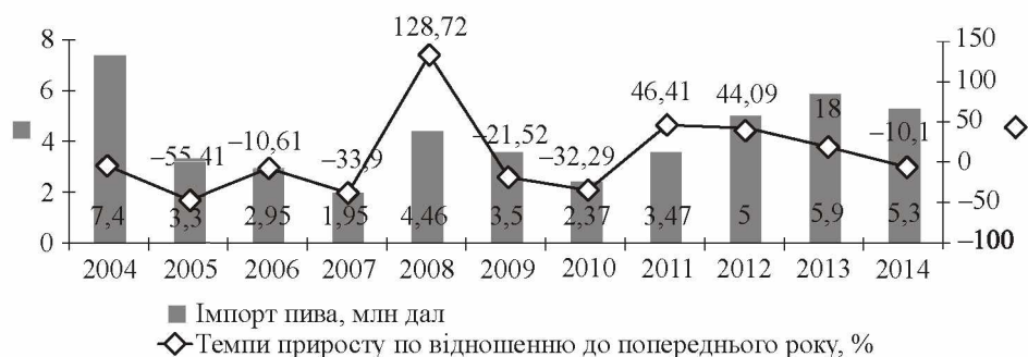
Рис. 3. Динаміка імпорту пива з України у 2004—2014 рр.

Завдяки збільшенню власного виробництва частка імпортного пива в Україні у 2004—2007 рр. зменшилася з 7,4 до 1,95 млн дал (рис. 3).