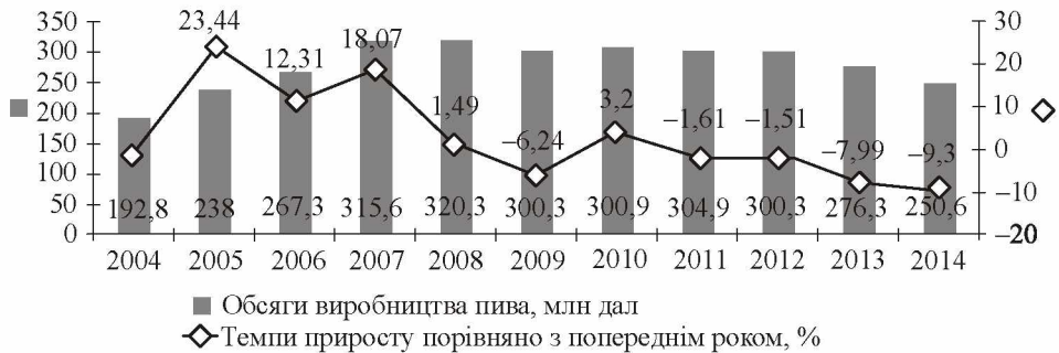
Рис. 1. Динаміка виробництва пива в Україні у 2004—2014 рр.

Виклад основного матеріалу. Пивна галузь є потужною складовою харчової промисловості України. Виробництво пива — це давнє мистецтво, яке приносить зиск його споживачам (задоволення від смакування напою), виробникам (прибуток) і державі (податки). Ринок пива країни останні 11 років розвивається досить інтенсивно (рис. 1). Динаміка виробництва напою в Україні за 2004—2007 рр. мала тенденцією до зростання (від 12 до 23 %) внаслідок покращення економічної ситуації в країні, і, відповідно, й купівельного попиту населення. Спостерігається зростання культури споживання напоїв — перехід частини населення з міцних напоїв на споживання пива. У 2008 р. відбулася стабілізація виробництва, а у 2009—2012 рр. — скорочення (з невеликим зростанням у 2010 р.) випуску пива, що дало поштовх до посилення конкурентної боротьби. Основною причиною цих тенденцій стала світова економічна криза [1—2].