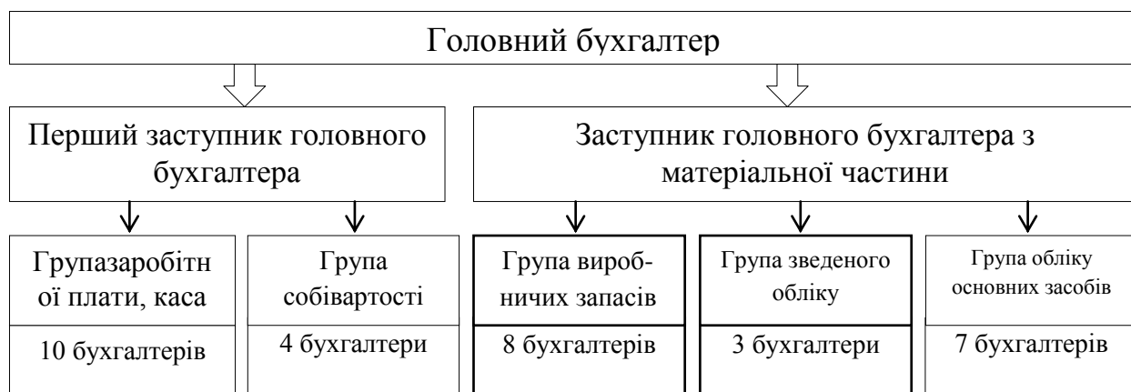
Рис. 2.1. Структура бухгалтерії ПрАТ «Оболонь»

Загальну організаційну структуру бухгалтерії ПрАТ «Оболонь» зображено на рис.2.1.