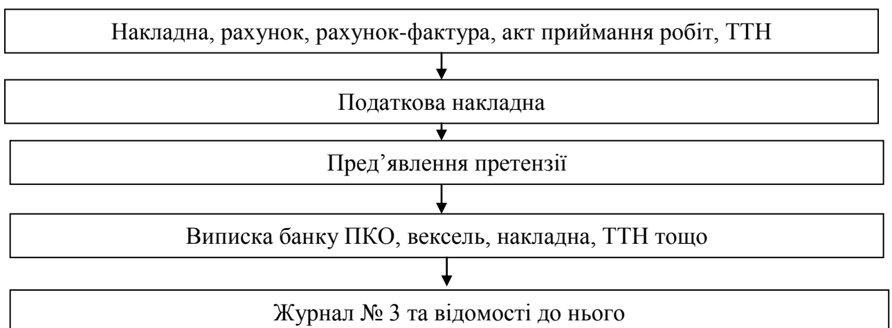
Рис. 1.3. Документообіг за операціями з дебіторською заборгованістю за товари, роботи, послуги

У структурі дебіторської заборгованості ПрАТ «Оболонь» саме дебіторська заборгованість за товари, роботи, послуги займає значну вагу, тому документообігу по цьому виду заборгованості приділити особливу увагу. Адже документообіг має безпосереднє відношення до відображення цієї заборгованості в обліку.