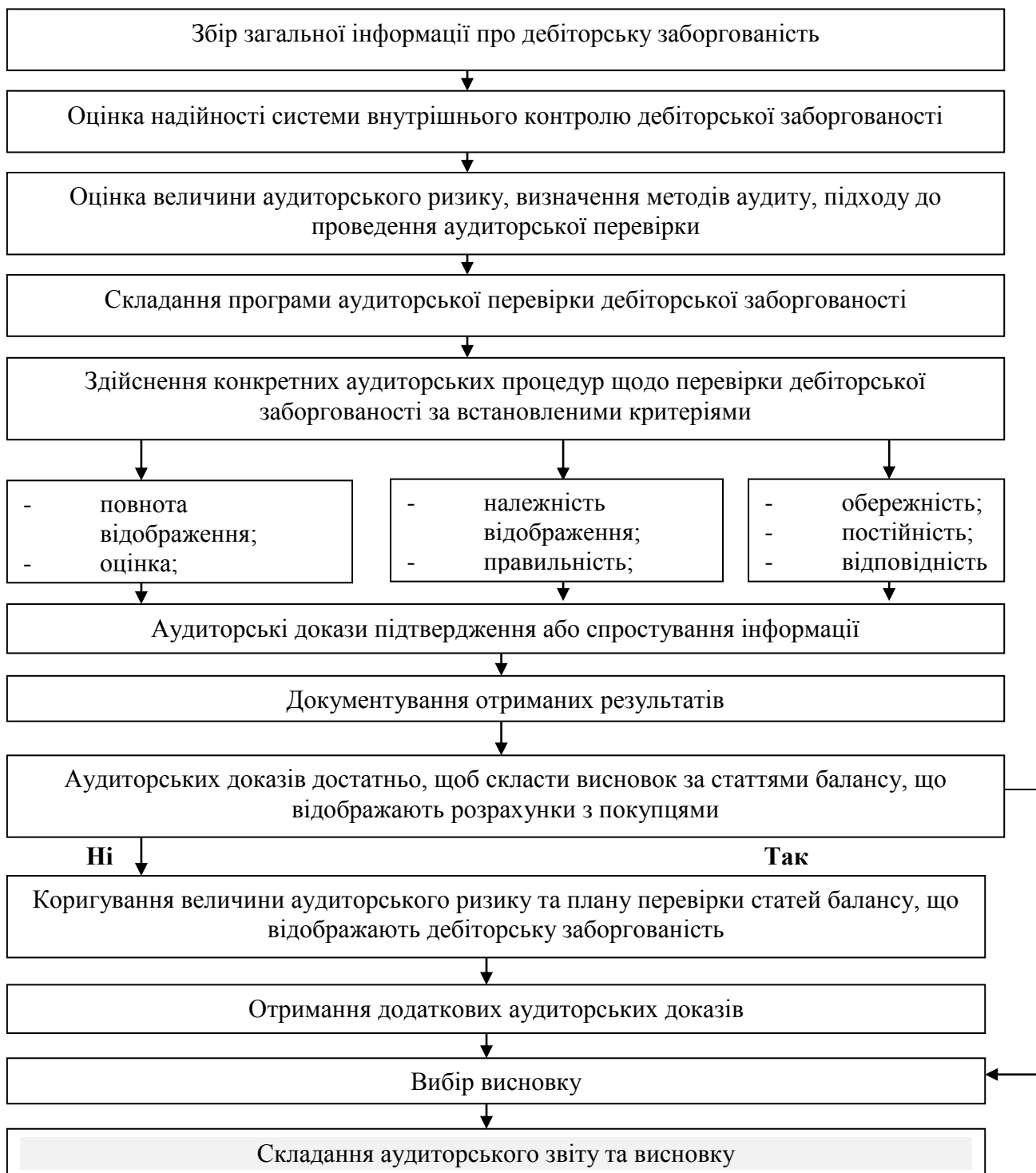
Рис. 3.1. Послідовність проведення аудиторської перевірки дебіторської заборгованості.

На рис. 3.1 зображено етапи проведення аудиту дебіторської заборгованості.