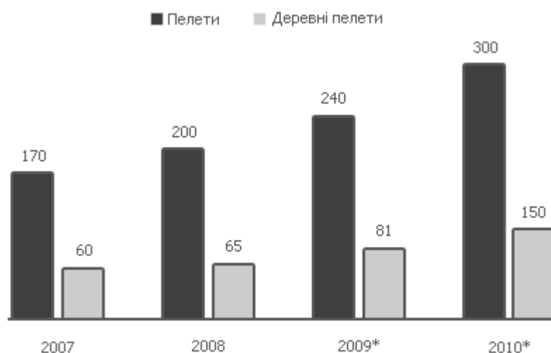
Рис. 1 Виробництво піллет в Україні

Внутрішній споживчий ринок України становить близько 15% від обсягу виробництва або 36 тис.т./рік. Потенційний споживчий ринок піллет в Україні складає більше 1 млн.т./рік.