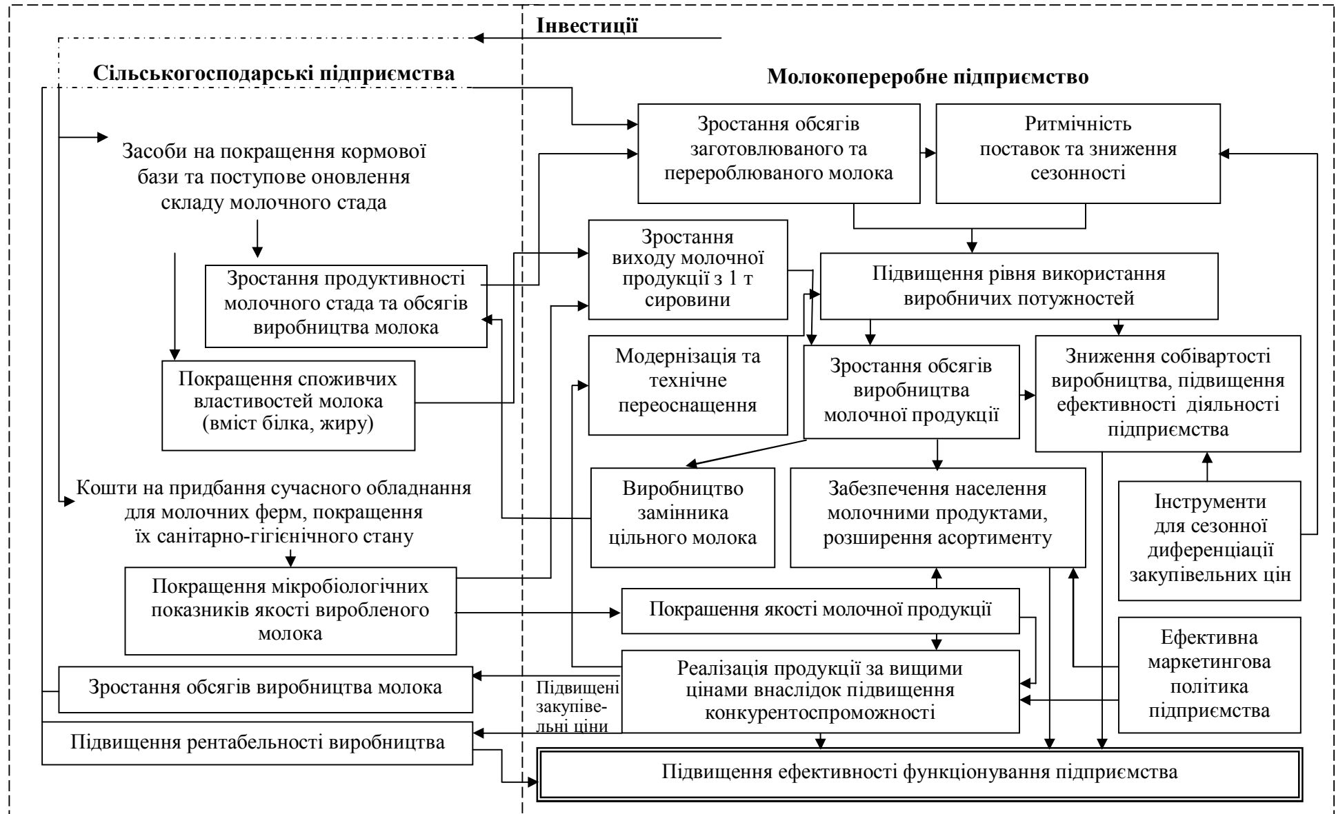
Рис. 2. Організаційно-економічний механізм підвищення ефективності функціонування підприємств молочної промисловості