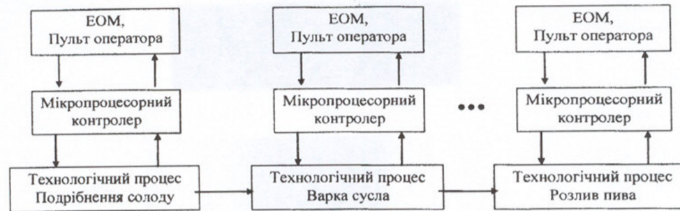
Рис. 1. Програмно-технічний комплекс виробництва пива

Така побудова системи програмно-технічного комплексу можлива для вирішення локальних задач автоматизації і задач оптимізації певних технологічних процесів. Дана структура може бути рекомендована для будь-якої ділянки виробництва пива.