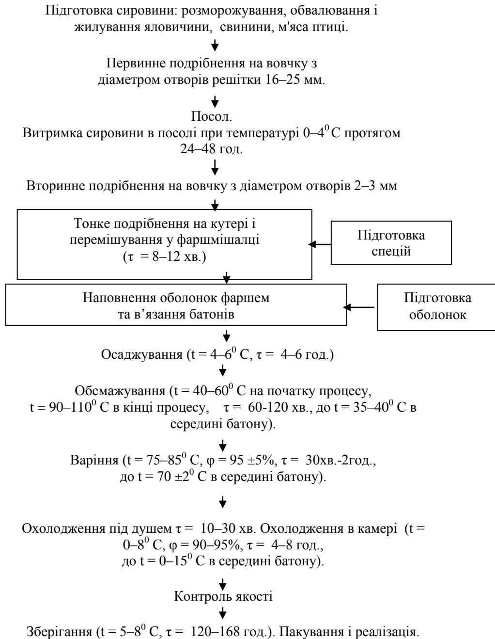
Рис. 4. Блок-схема технології виробництва варених ковбас

Схематично процес виробництва варених ковбас із додаванням м'яса птиці зображено на рис. 4.