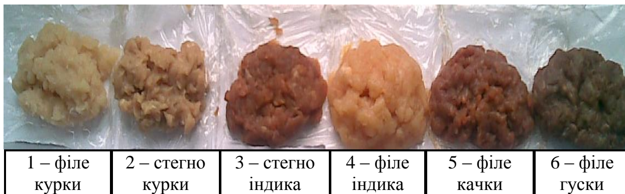
Рис. 2. Дослідні зразки м'яса різних видів птиці

Для проведення досліджень нами було обрано чотири види м'яса птиці: куряче, качине, індиче, гусяче (рис. 2). Зокрема куряче та індиче м'ясо ми розділили на біле та червоне. До білого належить філе – грудні м'язи, до червоного – стегнові.