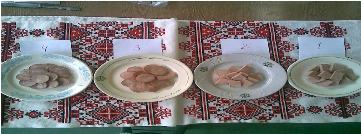
Рис. 3. Зразки готової продукції

Масову частку м'яса птиці в процесі розробки рецептур варіювали від 10 до 35%. В результаті органолептичної оцінки було встановлено, що до складу рецептур варених ковбас доцільно вводити його у кількості 15%. Результати дегустації дають можливість стверджувати, що всі вироби мають приємний смак та аромат, привабливий вигляд і традиційну консистенцію.