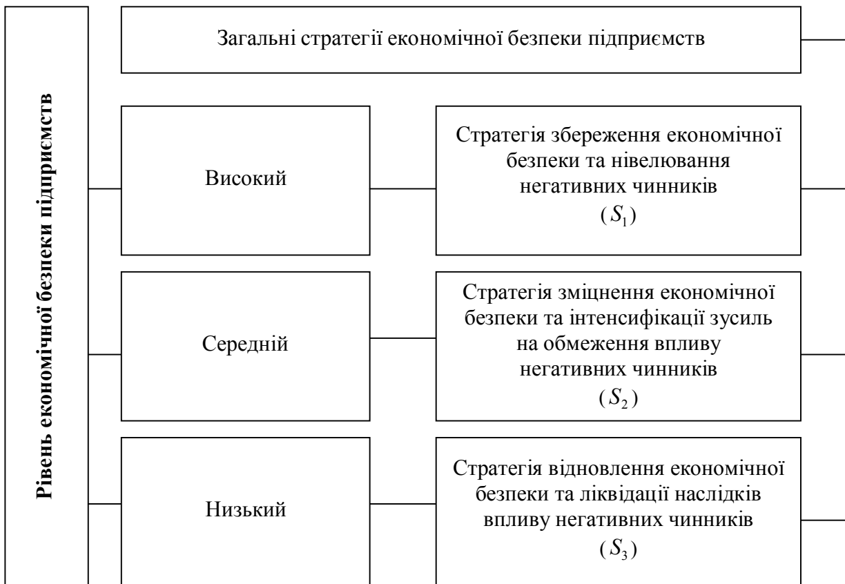
Рис. 3. Загальні стратегії економічної безпеки підприємств

підтримання позитивних тенденцій до посилення економічної безпеки підприємства, а з іншого боку, гарантує її стабільність. Ця стратегія передбачає швидке реагування на негативні чинники, що містить чітко продумані дії, які дозволять пристосуватися в максимально короткі строки.