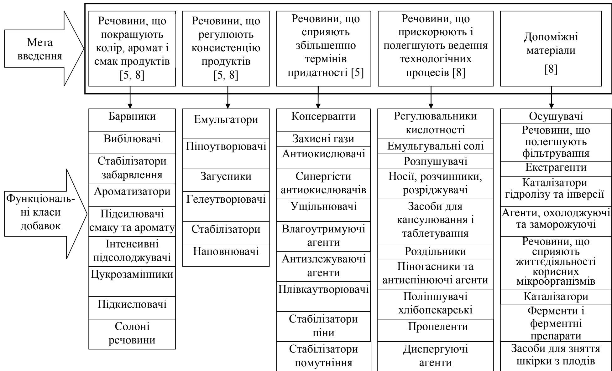
Рисунок 1 - Класифікація ХД за технологічними функціями