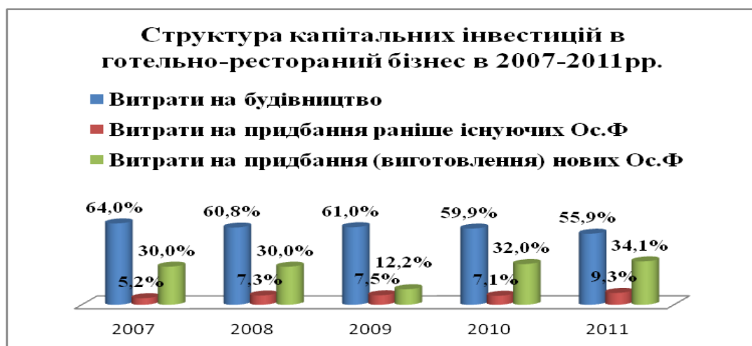
Рисунок 3. Структура капітальних інвестицій на підприємствах готельно-ресторанного бізнесу [складено автором за матеріалами Статистичного щорічника 2011р. ,3]

При цьому зростання обсягів наданих послуг спостерігалось як по готелях, так і по інших місцях тимчасового проживання. Необхідно зазначити, що це зростання було обумовлене не зростанням цін на послуги тимчасового розміщення, оскільки відповідний індекс цін мав тенденцію до зниження в 2009 році з 108,8% до 103,2% в 2012 році. Отже, зростання вартості наданих послуг було обумовлене саме збільшенням фізичного обсягу реалізованих послуг, про що свідчить тенденція щодо зростання обсягу реалізованих послуг в порівнянних цінах за період з 2009 по 2012 на 54%. Щорічні індекси мають дещо нижчі значення, але все одно підтверджують той факт, що обсяги наданих послуг в 2012 році порівняно з попереднім періодом зросли на 15,5%. Основною причиною такого зростання знову таки був чемпіонат Євро-2012.