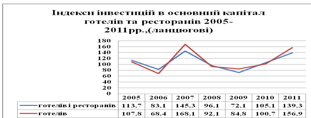
Рисунок 2. Індекси інвестицій в основний капітал готелів та ресторанів [складено автором за матеріалами Статистичного щорічника 2011р. ,3]

В структурі капітальних інвестицій протягом даного періоду переважали витрати на будівництво (в середньому 60%) та витрати на придбання (виготовлення) нових основних фондів (в середньому 30%). Це свідчить про достатньо прогресивну структуру капітальних вкладень в сфері готельно-ресторанного бізнесу. Але останнім часом спостерігаються повільні структурні зрушення у складі капітальних вкладень в напрямку зменшення частки витрат на будівництво (з 64% до 55,9%) та одночасного зростання частки витрат на придбання основних фондів (з 30% до 34%), див. рисунок 3. Це пояснюється тим, що з підготовкою до Євро-2012 ресторанно-готельний бізнес почав стрімко реконструюватись. Готелі та ресторани Одеси, Дніпропетровська, Києва, Львова, Донецька та інших міст посилено готувались до чемпіонату та прийому туристів.