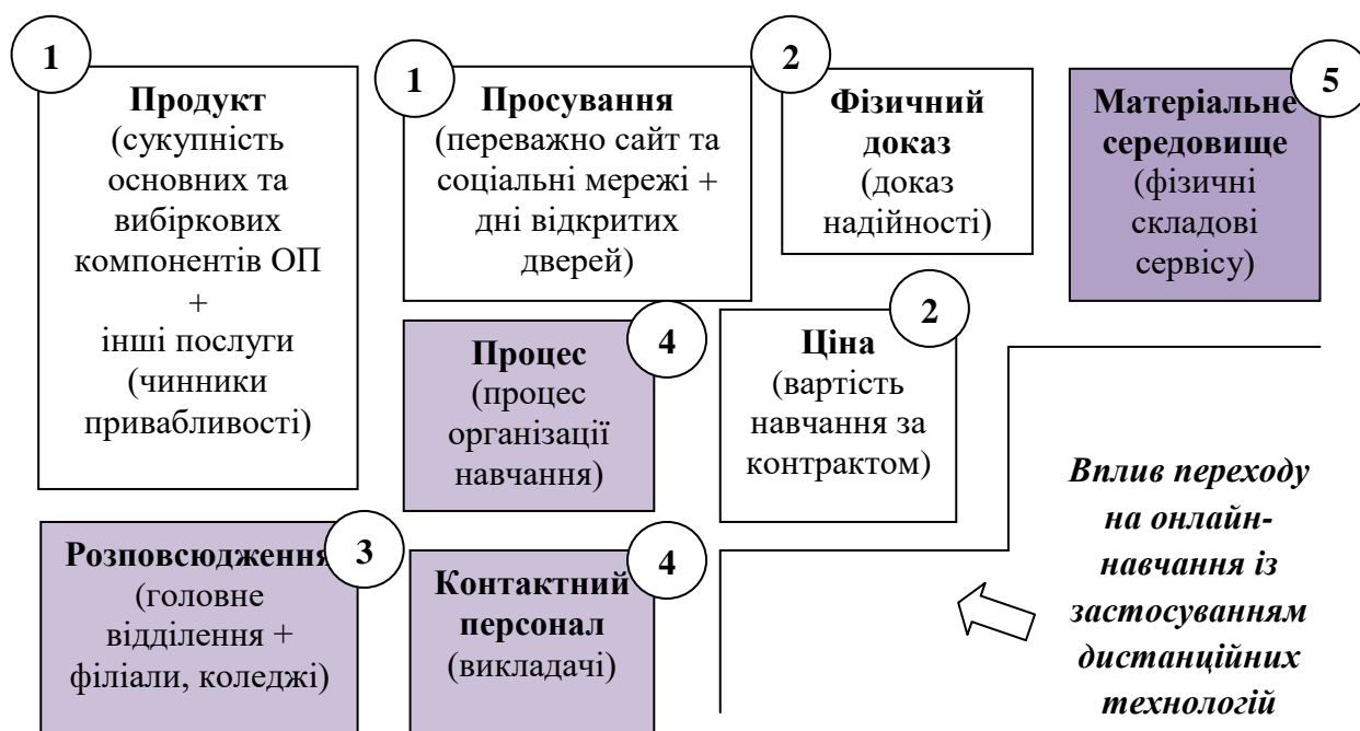
Рис. 1. Рівень впливу діджиталізації освіти на елементи маркетинг-міксу освітніх послуг (за п'ятибальною шкалою)

Дистанційні технології неодмінно чинитимуть вплив на комплекс маркетингу освітніх послуг, і сила впливу для різних елементів буде неоднаковою. На рис. 1 представлена система маркетинг-міксу освітнього сервісу, а також відмічена ступінь впливу діджиталізації на кожен елемент за п'ятибальною шкалою. Якщо розглядати продуктову політику ВНЗ як сукупність ОК та ВК освітніх програм, то сила впливу діджиталізації освіти буде незначною. Додаткові чинники привабливості освітнього продукту можуть розширюватись (наприклад, можливість відвідування не лише очних, але й дистанційних вебінарів, організація онлайн-лекцій із представниками інших країн тощо).