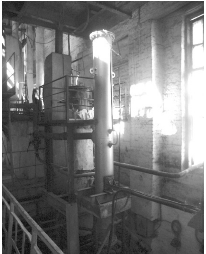
Рис.4. Вид змонтованого підігрівника «білої» потоки I кристалізації ПДС – 400 - 4

1. Ю.С. Разладин, С.Ю. Разладин, Н.А. Прядко. Особенности теплообмена в присутствии неконденсирующихся газов в паровых камерах теплообменных аппаратов Сахар. – 2006 - №5. – с. 46-49.