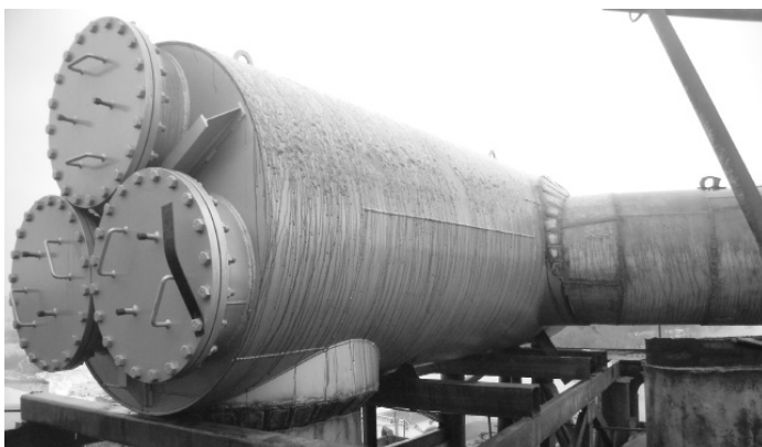
Рис.3. Вид змонтованого підігрівника дифузійного соку ПДСУ-1600-3, що обігривається вторинною парою вакуум-апаратів

тя хоча би 10% коштівнаправлених на впровадження високоефективних, але не пристосованих для вітчизняних технологічних схем очистки, теплообмінних апаратів, були адресовані фірмам, що працюють в напрямку розробки сучасних високоефективних кожухотрубних підігрівників, а також використати вітчизняні наукові дослідження, що базуються на науковій школі Н.Ю. Тобілевича, то, можливо, і не народжувалися би міфи про беззаперечну перевагу вище вказаних підігрівників, а сьогодні більшої міри застосовувалися не менш високоефективні кожухотрубні апарати вітчизняної розробки.