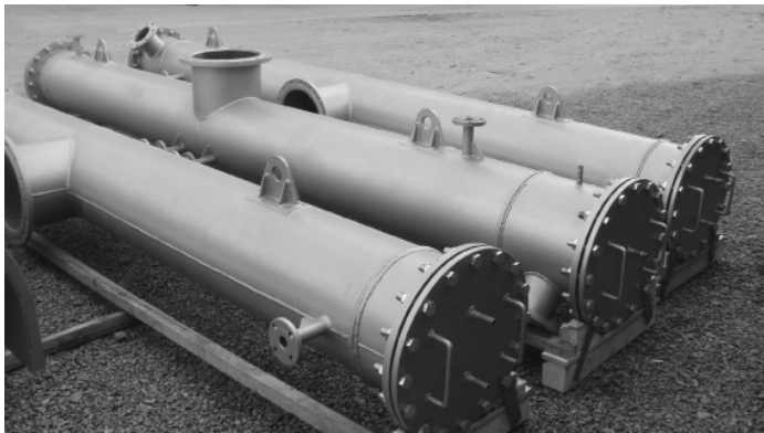
Рис.2. Підігрівники ПДС 400-4