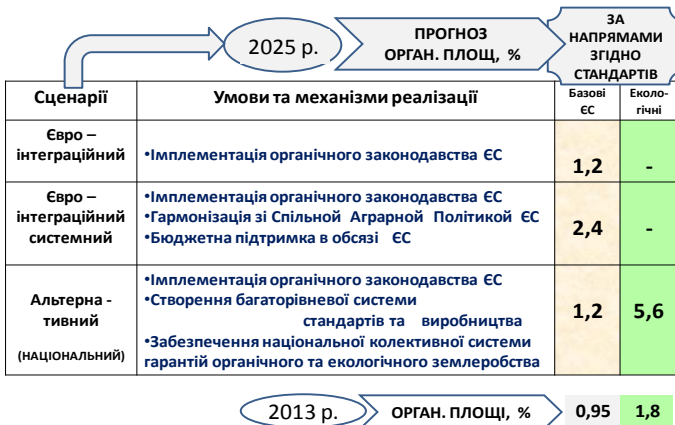
Рисунок 2 – Базові положення стратегії

У той же час, як в Україні, так і закордоном, наявні розробки постіндустріального ведення сільськогосподарського виробництва з