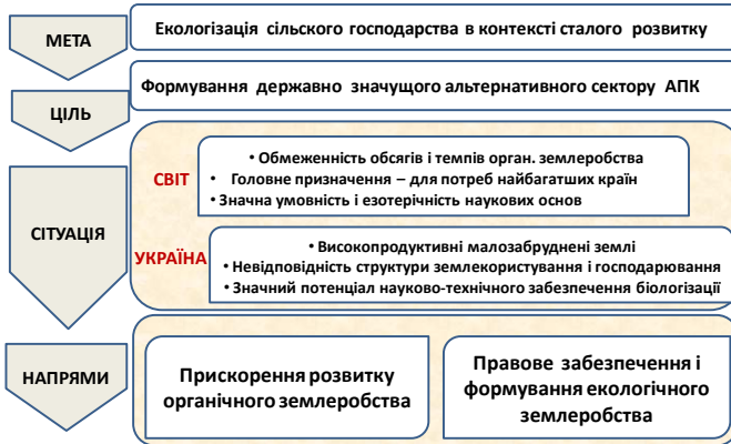
Рисунок 1 – Структура концепції

Проте, для сільськогосподарського виробництва є характерним комплексний вплив на довкілля шляхом формування та експлуатації спеціалізованих агробіоценозів.