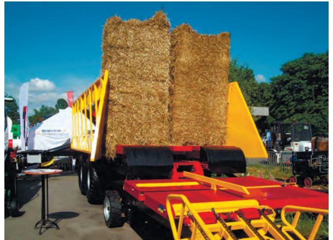
Рис. 6 – Самозавантажувальний тюковоз ПТ-16 «Квадро»

«Gonella» представлений на виставці ТОВ «Агротехніка».