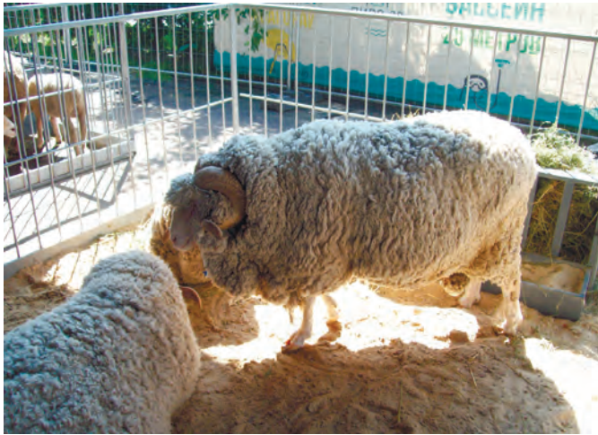
Рис. 4 – Вівці асканійської породи

На виставці були представлені різні види сільськогосподарських тварин від провідних господарств, проведений аукціон племінних тварин. ДПДГ «Асканійське» експонувало овець асканійської породи таврійського типу (рис. 4).