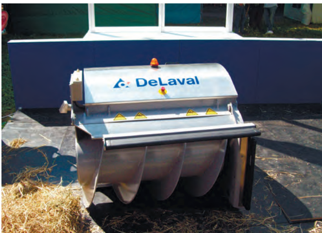
Рис. 1 – Автоматизований підгортач кормів

Вперше фірмою «DeLaval» (Швеція) був експонований автоматизований підгортач кормів на кормовому столі «OptiDuo» (рис. 1).