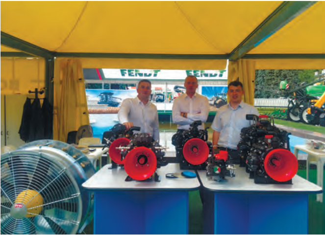
Рис. 9 – Експозиція фірми «Бондіолі і Павезі» на АГРО-2019 Науково-дослідні організації на «АГРО-2019».

Елементна база була широко представлена компанією «Бондіолі і Павезі» (рис. 9). Компанія «Бондіолі і Павезі» пропонувала відвідувачам виставки карданні передачі, розпилювачі до обприскувачів, сервоприводи та коробки передач.