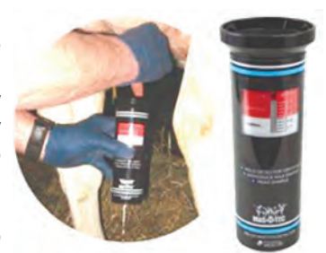
Рис. 2 – Пристрій для діагностики субклінічних маститів у корів

Діагностика субклінічних маститів у корів – це постійно актуальна проблематика в молочному тваринництві. У цьому контексті компанією «Investlab» вперше експонований новий пристрій американського виробництва «Mas-D-Тес» (рис. 2).