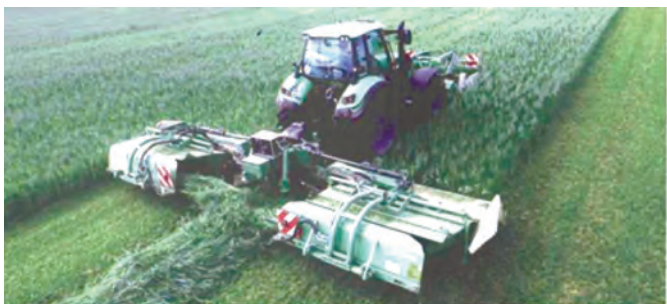
Рис. 5 – Косарка

До складу «зеленої лінії» – технічних засобів для заготівлі кормів фірми «SaMASZ» (Польща) входять косарки (рис. 5), перевертачі та валкоутворювачі.