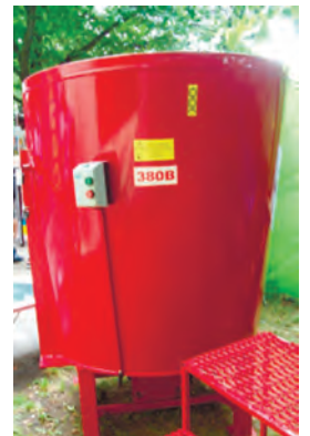
Рис. 8 – Малогабаритний кормозмішувач

Заслугує на увагу експонований на виставці пристрій для вимірювання твердості ґрунту «DataField». Пристрій складається з корпусу із можливістю під'єднання до нього щонайменше одного штиря зі знімним конічним наконечником, у корпусі розміщені тензометричний датчик для взаємодії із зазначеним штирем та ультразвуковий датчик для вимірювання величини занурення конічного наконечника в ґрунт, модуль для визначення координат на місцевості, а також електронний блок для оброблення електричного сигналу від тензометричного та ультразвукового датчиків, індикації результатів вимірювань, збереження їх у модулі пам'яті та можливістю локальної переда-