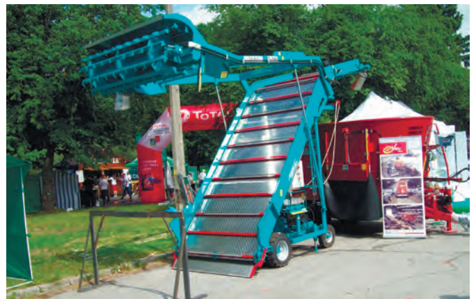
Рис. 7 – Нарізувач-завантажувач силосної маси «Taurus»

Зараз актуальною проблематикою є забезпечення невеликих фермерських та сімейних господарств сучасною міні-технікою. У ТОВ «Демі-мікс-Україна» виготовляють малогабаритні кормозмішувачі об'ємом 1,5-2,0 м 3 (рис. 8).