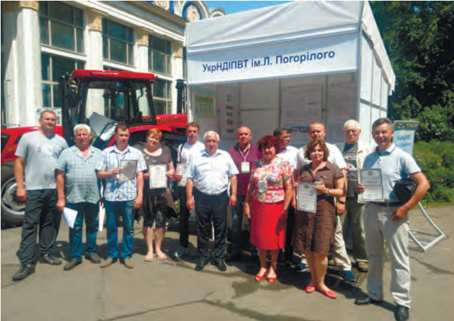
Рис. 10 – Вручення дипломів учасникам «АГРО-2019»

У роботі виставки взяли участь науково-дослідні і навчальні інститути, серед них УкрНДІПВТ ім. Л. Погорілого, ННЦ ІМЕСТ, НУБіП України та інші.